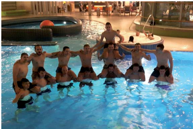
Unsere Aktiven - auch im Wasser obenauf