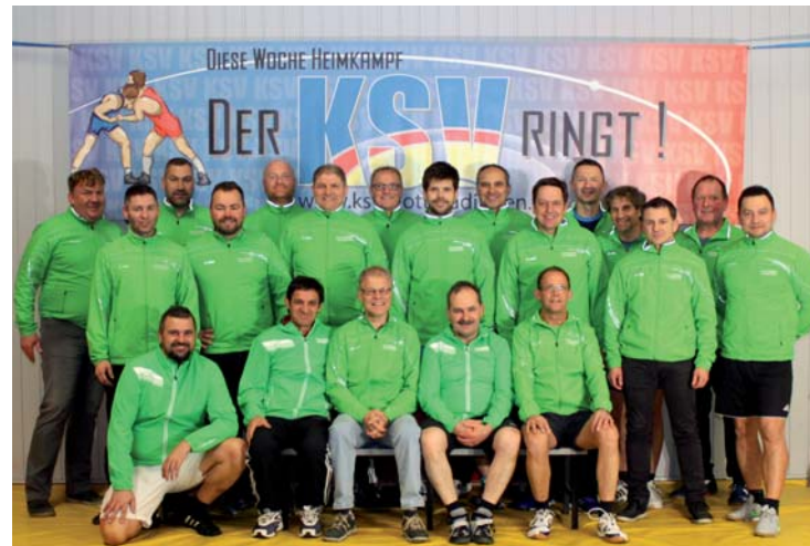
Unsere AH-Gruppe - gute Laune garantiert