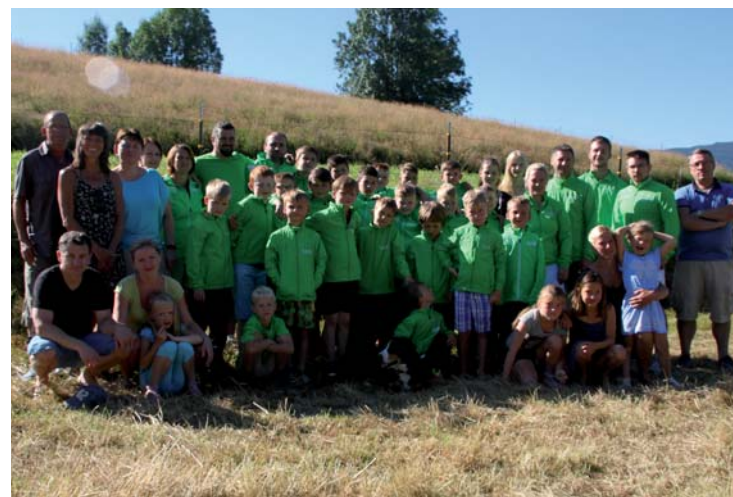
Unser Verein - auch in der Freizeit ein Team