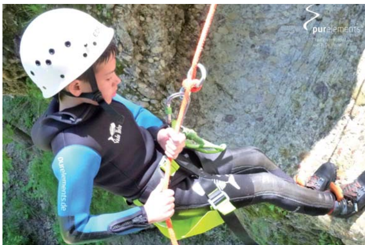
Unser Deutscher Meister am Seil